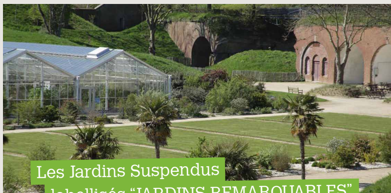
Les Jardins Suspendus labellisés "JARDINS REMARQUABLES"

La Ville du Havre a accueilli en 2014 le colloque Eduquer à la nature destiné aux professionnels et aux acteurs associatifs haut-normands de l'éducation à l'environnement. Ces journées permettent de faire le point sur les avancées du Plan régional d'actions «Eduquer à la Nature» et de proposer de nouvelles actions. Ce plan a vu le jour grâce aux travaux du Collectif Eduquer à la Nature en Haute-Normandie composé de six associations (l'AREHN, CARDERE, HNNE, le Conservatoire des Espaces Naturels de Haute-Normandie, la LPO, le Réseau des Clubs CPN de Haute-Normandie) ainsi que du Parc Naturel Régional des Boucles de la Seine Normande.