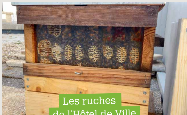
Les ruches de l'Hôtel de Ville

Les Jardins Suspendus, installés dans le fort de Sainte-Adresse qui surplombe la baie de Seine, viennent d'être labellisés par le Ministère de la Culture «Jardin remarquable». Ce label témoigne de la qualité des Jardins Suspendus d'un point de vue botanique et de l'attention portée à l'accueil du public.