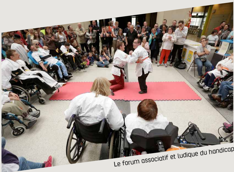
Le forum associatif et ludique du handicap.

Aménagé vers l'entrée nord des Jardins Suspendus, le tout nouveau pollinarium permettra de suivre quotidiennement les émissions de pollens et de privilégier les traitements préventifs pour les personnes allergiques. Au cœur de ce nouveau jardin ont été plantées des plantes locales à fort pouvoir allergisant, soit 7 graminées, 8 arbres (bouleau, chêne, frêne, noisetier...) et 4 herbacées.